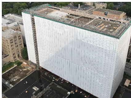
Image : Échafaudage de l'enveloppe de la tour Ferguson